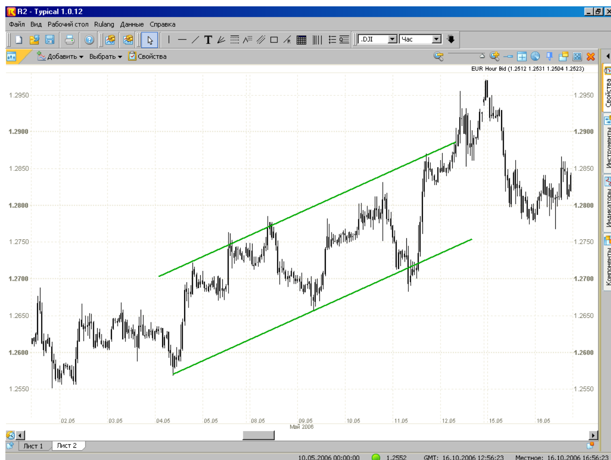
Рис. 3. EUR, восходящий канал

Как интерпретировать информацию, полученную с помощью линий поддержки, сопротивления или линий канала? Если цена приближается к любой из перечисленных линий, то она встречает на своем пути некоторое препятствие. Преодоление этого препятствия происходит только тогда, когда достаточное количество игроков входят в рынок в одном направлении, что часто происходит, например, как реакция рынка на выходящие новости по экономике, политике или экстраординарные события (теракты, военные действия или природные катаклизмы). В этом случае говорят о пробое линии поддержки или сопротивления, границы канала или существенной линии графической фигуры и о вероятности дальнейшего активного движения цены.