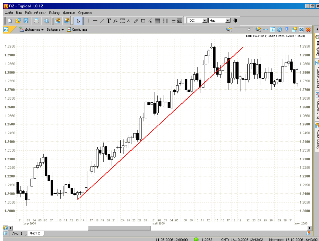
Рис. 2. EUR, восходящий тренд

Однако цена редко движется по прямой линии. Скорее, она движется по зигзагообразной линии, что свидетельствует о непрерывной смене доминирующей группы игроков на рынке: побеждают то «медведи», то «быки». Если минимумы и максимумы цены возрастают (или понижаются) примерно в одинаковом темпе, то в таком случае говорят о движении цены в канале (рис. 3). Канал строится так: берем за основу либо линию поддержки на восходящем тренде либо линию сопротивления на нисходящем, добавляем к этой линии параллельную линию, проведенную через самый большой High на восходящем рынке или через самый низкий Low – на нисходящем рынке; в итоге получается канал, внутри которого движется цена.